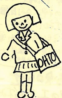
(袋物は紐に白ぬき)